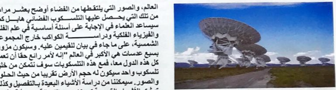
مرصد ألما المليميترى الكبير عبارة عن منصة من أجهزة المراقبة التلسكوبية، وتقع في صحراء أتاكاما شمال الشيلي. ونظرا لأهمية ارتفاع الموقع وجفافه يسهل الرصد في حين التلسكوب الموجي المليميترى، فقد تم إنشاء المرصد على هضبة تشايلانكو على ارتفاع يبلغ خمسة آلاف متر. مرصد ألما عبارة عن شراكة علمية بين أوروبا والولايات المتحدة وكندا وشرق آسيا والشيلي وسيكون هذا التلسكوب الأكبر في العالم، الصور التي يلتقطها من الفضاء أوضح بعشر مرات من تلك التي يحصل عليها التلسكوب الفضائي هابل كما سيساعد العلماء في الإجابة على أسئلة أساسية في علم الفلك والفيزياء الفلكية ودراسة الكواكب خارج المجموعة الشمسية، على ما جاء في بيان للقيمين عليه. وسيكون مرصد سبع عدسات هي الأكبر في العالم "لأنه رافع حقا أن تعمل كل هذه الدول معا، فمع هذه التلسكوبات سوف تمكن من خلق تلسكوب واحد سيكون له حجم الأرض تقريبا من حيث الحلول والصور. سيمكنا من دراسة الأشياء البعيدة بالتفصيل وكذلك توثيق الأشياء القريبة مركز ذرب التلسكوب، مسألة التلوث الأسود التي يمكن حلها بواسطة هذا النوع من الملاحظات".

قال الخبير لارس إريك نيمان ومن بين الظواهر الفلكية التي سيرصدها التلسكوب المادة المعتمة الغامضة التي يعتقد أنها تمثل ستة وتسعين في المائة من مادة الكون، وهو تعبير أطلق على مادة افتراضية لا يمكن قياسها إلا من خلال تأثيرات الجاذبية الخاصة بها والتي بدورها لا تستقيم حسابيا للعديد من نماذج تفسير الانفجار العظيم وحركة المجرات.