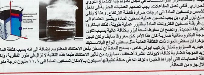
توصل العلماء إلى طريقة تسمح بتسخين المادة حتى درجة حرارة الشمس باستخدام أشعة الليزر خلال لحظة ويقول العلماء أن هذه الطريقة مهمة لاستمرار الدراسات في مجال تكنولوجيا الاندماج النووي الحراري. فلكي تعمل المفاعلات، يجب تصميم العمليات الجارية في داخل الشمس وتسخين المادة إلى درجات حرارة فائقة الارتفاع. وهذا لا يكفي صنع ليزر قوي، بل يجب تحسين عملية تسخين المادة وشيخ العلماء إلى أن طريقة تسخين الكتل ونات المادة بالليزر عملية طويلة، لذلك ابتكروا الطريقة الجديدة. الوضع أن سقوط أشعة الليزر بكثافة عالية يسبب تكون موجة اليكترو سائبة ضاربة كان هذا الأمر كان معروفا سابقا ولكن تبين مؤخرا أن بعض المواد ذات الكثافة العالية مثل بعض أنواع البلاستيك ويهيدريد الميوزيم تمتاز بتركيب أيوني خاص، يسمح للمادة أن تستقبل الموجة الضاربة بكثافة عالية، مما يزيد من تأثير الاحتكاك طبعها هذه التقنية لا تزال في طور النظرية، ولكن كفاءة الحسابات التي أجراها الخبراء تؤكد أنه في حالة تطبيقها سيكون بالإمكان تسخين المادة إلى ١١,٦ مليون درجة مئوية خلال جزء من النحلة.

التمريض : هو فن وعلم والتأسيسية وهو إمداد المجتمع بخدمات معينة علاجية في طبيعتها تساعد على بقاء الفرد صحيا كما تمنع المضاعفات الناتجة عن الأمراض والإصابات وله جانبان فني وآخر معنوي (نفسي واجتماعي). تاريخ التمريض في الإسلام: