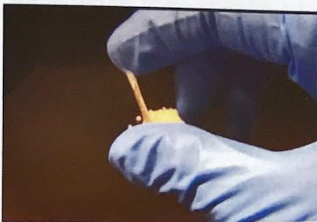
الغراء ان ابتكاره هو سيليكي استخداما واسعا في مجال لصق الاماكن التي يصعب توصيل المواد اللاصقة السائلة اليها.

ابتكر علماء اليابان نوعا جديدا من الغراء على شكل كريات صغيرة فالغراء والأصباغ، كما هو معروف، تكون عادة سائلة أو صلبة تصبح عند تسخينها لزجة ولاصقة، وتوجد عند تبريدها أما الغراء الذي ابتكره علماء من معهد أوساكي للتكنولوجيا في اليابان على شكل مسحوق من "كريات صغيرة" فيصعب مادة لاصقة عند ضغطه بعض الشيء. وقد صنع العلماء هذا المسحوق من ما يسمى "الزجاج السائل" وهو كناية عن كريات سائلة مغطاة بقاياك صلبة تحتفظ بالسائل في داخلها الغراء العلماء اليابانيون غلوا المسائل اللاصقة بطبقة من دقائق الدقائق المكونة من كريات الكاسيوم، وحصلوا على قسرات صغيرة، وتدخل هذه الدقائق عند الضغط عليها في الداخل محررة المسائل اللاصقة ويمكن استخدامها هذا الغراء حتى في لصق الأسطح الخشنة والخشبية، حيث يمكن رش كريات المسحوق على السطح المطلوب لاصقه ومن ثم الضغط عليه. ويقول مستر تو هذا