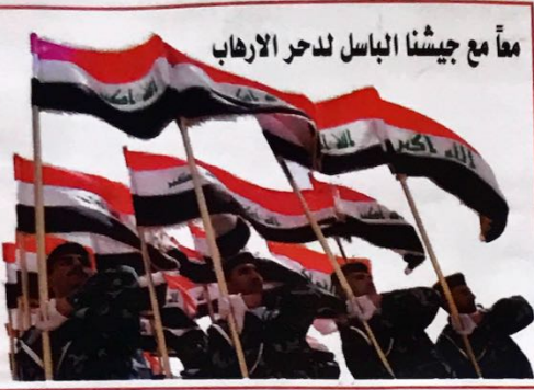
معاً مع جيشنا الباسل لدحر الإرهاب

سنة الأولى - العدد (الأول) تشرين الأول ٢٠١٤